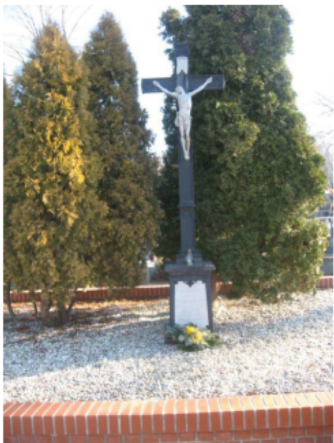
Důl Trojice, 3. ledna 1891. Pohřbeno 33 horníků z 61 obětí.

Dne 5. dubna v 10 hod. 30 min. došlo ve větrní jámě Františka k výbuchu. Po trhačí práci se vzňaly důlní plyny, které usmrtily 11 horníků.