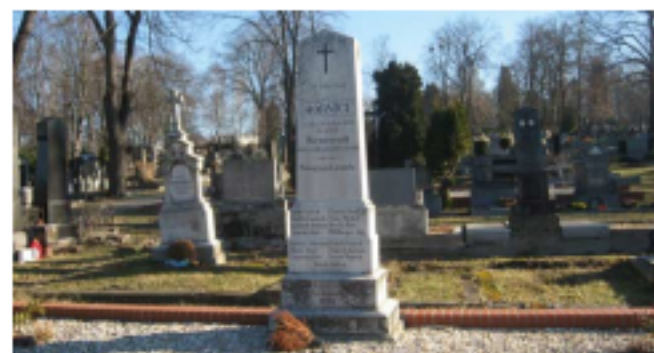
Důl Zárubek (tehdy Hermenegild), 14. ledna 1896. Pohřbeno 15 horníků ze 16 obětí.

V sobotu 3. ledna 1891 v 10 hod. 15 min. došlo na Wilczkové dole Trojice ve Slezské (tehdy Polské) Ostravě k výbuchu metanu a uhelného prachu v souvislosti s trhačí prací chodby ve sloji Mohutný. Následkem výbuchu zahynulo bezprostředně na svých pracovištích nebo na útěku povýbuchovými zplodinami 61 horníků. Při trhačí práci došlo k vyfouklé ráně, která zapálila metan a následkem nedostatečného větrání se oheň šířil dolem po metanových vrstvách a působil následné výbuchy.