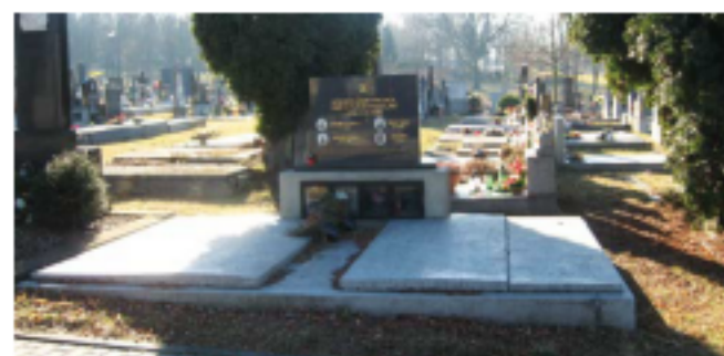
Důl Trojice, 3. září 1936. Pohřbeny všechny 4 oběti.