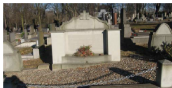
Jáma Salma VII, 1. září 1919. Pohřbeny všechny oběti.

Podle novinové zprávy (Ostrauer Zeitung) došlo na větrní jámě Salma VII v ranních hodinách k výbuchu a požáru důlních plynů. Neštěstí nepřežilo 9 horníků, 2 byli popáleni a 3 nezvěstní. Konečná bilance 13 mrtvých.