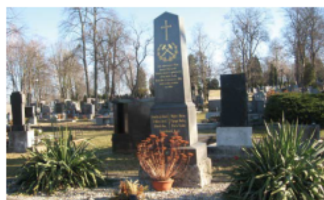
Jáma Salma VII, 3. srpna 1905. Pohřbeno 7 ze 14 obětí.

V úterý 14. ledna 1896 kolem 11 hod. 30 min. vznikl ve vodní jámě dolu Hermenegild akciové společnosti Severní dráhy Ferdinandovy z neobjasněných příčin požár, který ohrozil osádku celého dolu a vyžádal si 16 lidských životů a dalších 11 horníků bylo intoxikováno. Příčina požáru nebyla nikdy zjištěna.